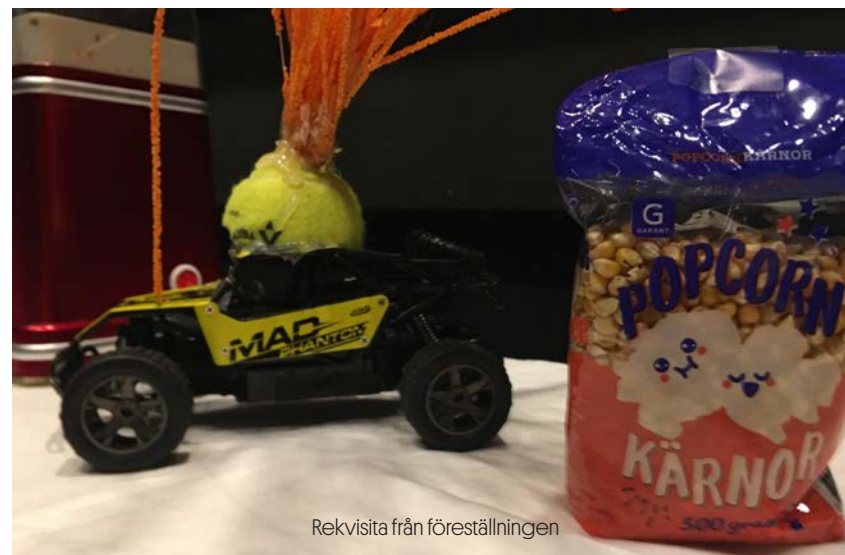
Rekvisita från föreställningen