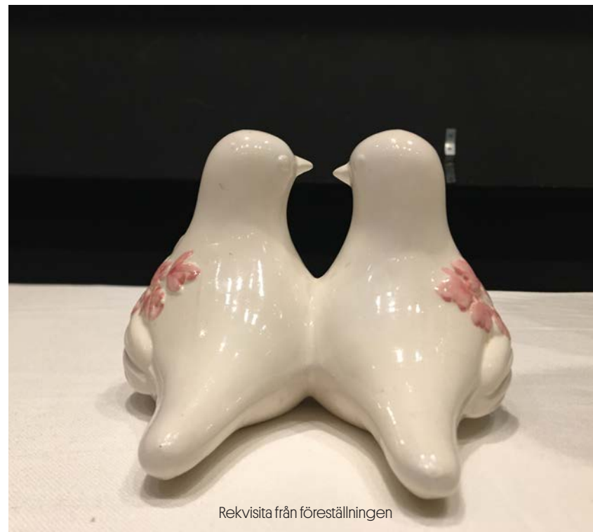
Rekvisita från föreställningen

Du är varmt välkommen att dela med dig av dina tankar eller återkoppla till oss på barnochunga@riksteatern.se