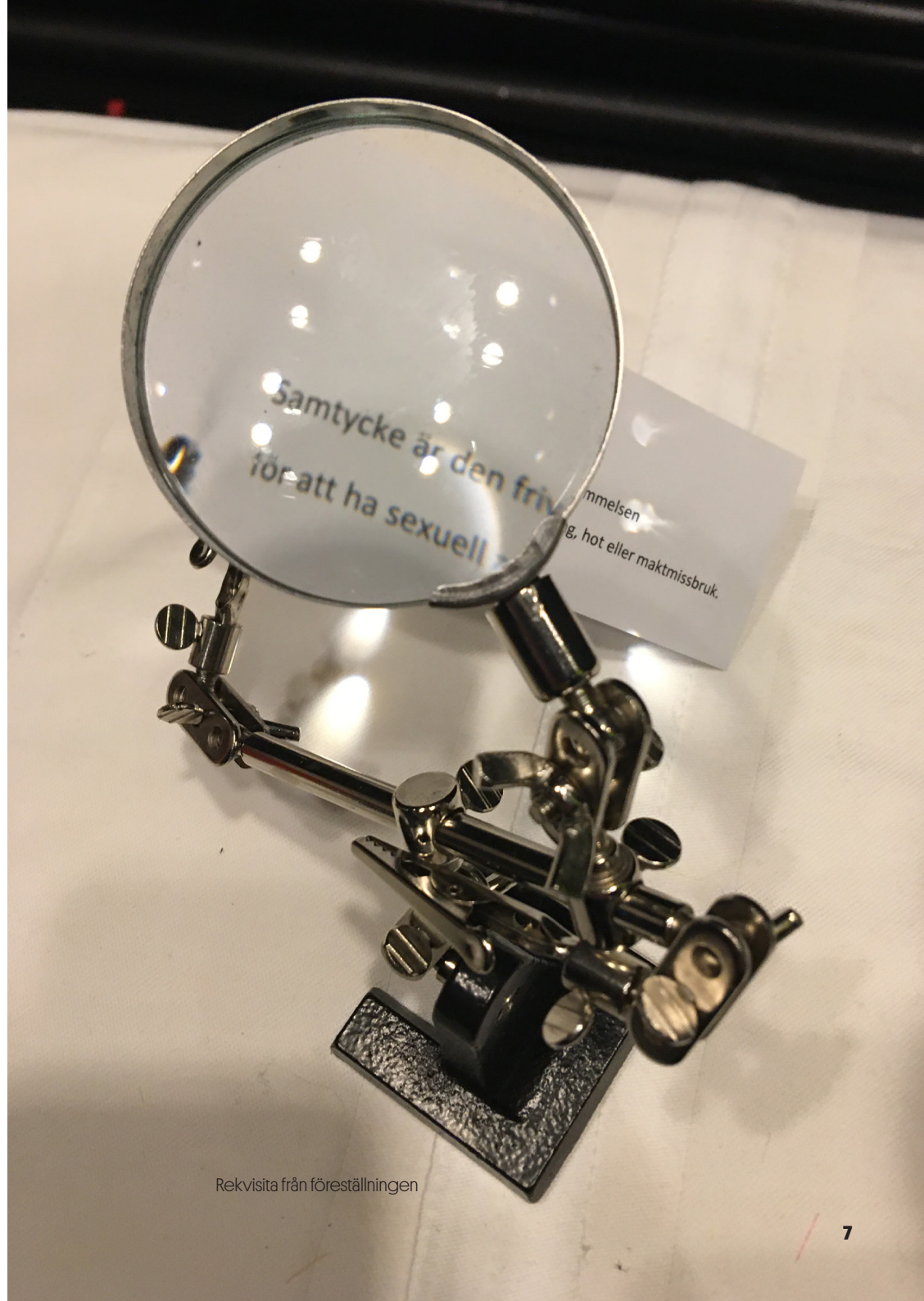
Rekvisita från föreställningen